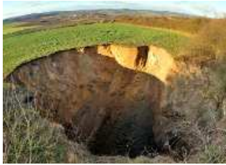
Einsturzkrater bei Rottleben

Ein Geologe sagte dem MDR, das Gebiet sei für derartige Erdbewegungen bekannt. Erdfälle entstehen, wenn in einigen Hundert Metern Tiefe Salze ausgewaschen werden und das Gestein nachrutscht. Der Erdfall sei nicht infolge des Bergbaus entstanden. Insofern sei er auch nicht mit dem Erdbeben von Nachterstedt in Sachsen-Anhalt vergleichbar. Ein von der Entstehung ähnlichen Erdfall habe es vor Jahren in Tiefenort im Wartburgkreis gegeben. (ddp)